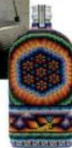
Mezcal 'A.M.A Huichol', Alacrán (115 €).

delfines. En la primera, merece la pena darse un paseo y hacer parada en alguno de sus puestos de artesanía para llevarse un souvenir . La segunda, convertida en parque nacional, es perfecta para los amantes de la naturaleza, ya que se pueden avistar aves, tortugas y hasta tiburones.