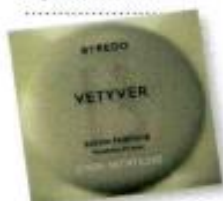
Jabón perfumado 'Vetiver', Byredo (30 €).

UN PLUS Para cenar, pide mesa en la biblioteca y disfruta de las maravillas culinarias de Botànic, el restaurante del hotel. Cuando te ofrezcan sus postres envasados en tarros de cristal, ¡pide probarlos todos!