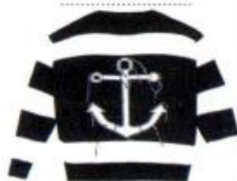
Jersey, Jorge Vázquez (190 €).

UN PLUS Aunque la embarcación tiene cocina, puedes añadir algunos extras como barbacoa o comida (incluye lo básico para los primeros días). También puedes contratar el servicio de limpieza (recomendable) o el alquiler de bicicletas.