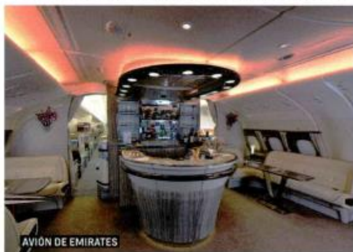
AVIÓN DE EMIRATES