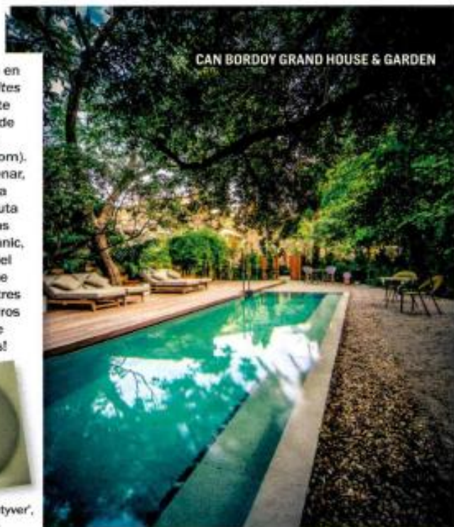
CAN BORDOY GRAND HOUSE & GARDEN

PRECIO Alojarte en una de las 24 suites de Can Bordoy te costará a partir de 270 €/noche