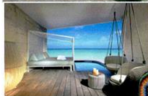
Arriba, infinity pool del TRS Coral Hotel. Izda., terraza de una de las suites con minipiscina.

PRECIO Junior suite con terraza y cama king size para dos personas, desde 285 €/noche ( palladiumhotelgroup.es ).